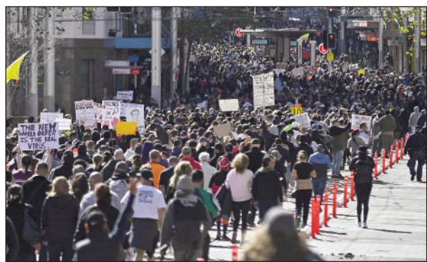
Thousands of anti-lockdown protestors march on the streets of Sydney on Saturday against month-long stay-at-home orders.

"Officers from across Central Metropolitan Region, assisted by specialist resources, were deployed. So far during the operation, a number of