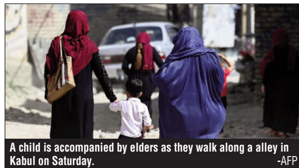
A child is accompanied by elders as they walk along an alley in Kabul on Saturday.

The Taliban on Saturday slammed the US airstrikes in the Afghan provinces of Kan-